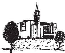
京田辺キャンパス (新島記念講堂 10:35~10:55)