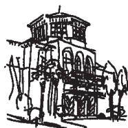
今出川キャンパス (栄光館ファウラーチャペル 10:35~10:55)